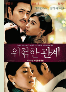
〈위험한 관계〉 포스터