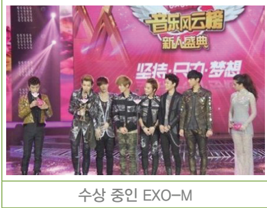
수상 중인 EXO-M

○ EXO-M*, '음악풍운방 신인성전'**서 최고 인기 그룹상 수상 (‘12.9.17, 북경)