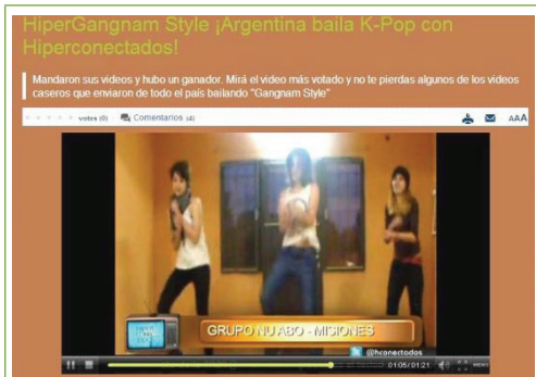
경연대회 우승자 동영상 캡처 화면

○ 텔레페*, ‘강남스타일 비디오 경연대회’ 개최(‘12.8월 말~9월 중순)