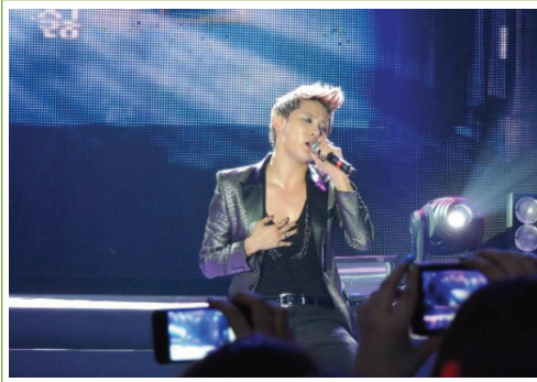
김준수 공연 모습