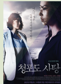
청포도 사탕 포스터