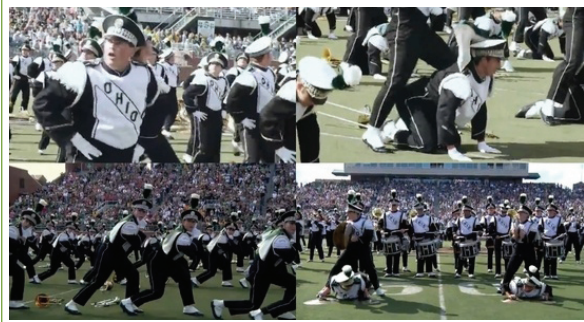
말춤 커버댄스 모습