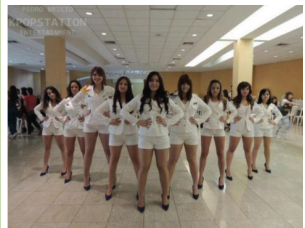
K-Pop 경연대회 참가자