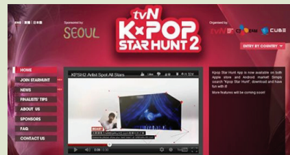
K-Pop Star Hunt 홈페이지